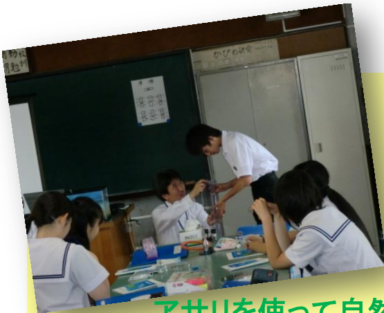
アサリを使って自然の浄化作用を観察しよう!