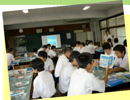
水は大切に使わなくてはならない