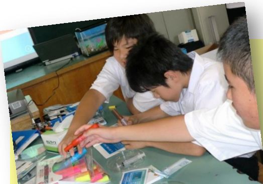
意外に作るのが難しい、あめんぼう!!