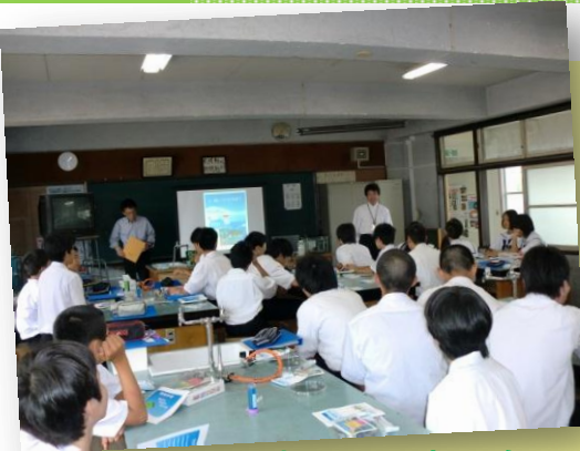
水は限りあるもの