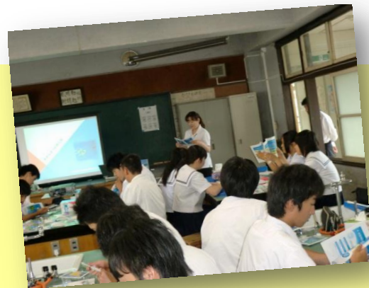
あめんぼうで水の汚れを知ろう!